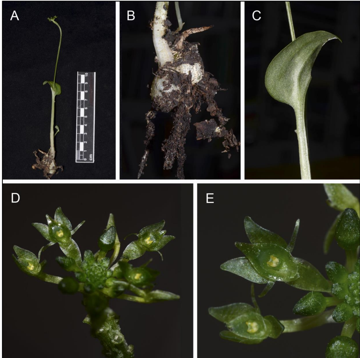
Figura 1. Malaxis magnaauriculata . A. Planta en floración removida del sustrato. B. Base de la planta mostrando las raíces, el cormo en desarrollo (izquierda) y el cormo de la temporada de crecimiento previa (derecha). C. Envés de la lámina foliar. D. Racimo en vista superior. E. Acercamiento de dos flores. Fotografías de Gerardo A. Salazar, de Castañeda-Zárte y Castañeda Zárte MCZ-1288 .